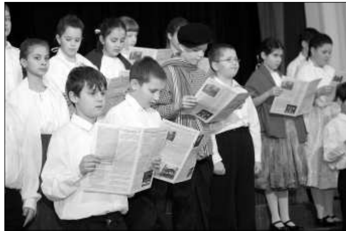
Az iskolások előadása

évig volt az MTV munkatársa, jelenleg a Budapest Televízió műsorvezető-szerkesztő munkatársa – először Jókai Mórnak, az 1848. március 15-i eseményekről írt feljegyzéséből olvasott fel, majd a 161 évvel ezelőtt történetekkel kapcsolatban mondta el gondolatait, összehasonlítva az